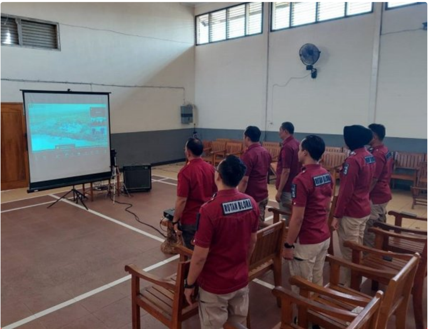
Rutan Blora Ikuti Webinar Series 5 Bersama BPSDM Hukum dan HAM

Blora – Rumah Tahanan Negara (Rutan) Kelas IIB Blora Kantor Wilayah Kementerian Hukum dan Hak Asasi Manusia (Kemenkumham) Jawa Tengah mengikuti Webinar Series 5 bertema “Powerful Coaching, Mentoring, dan Counseling untuk Perubahan Organisasi dan Pengembangan Kompetensi ASN.” Kegiatan yang diadakan oleh Badan Pengembangan Sumber Daya Manusia